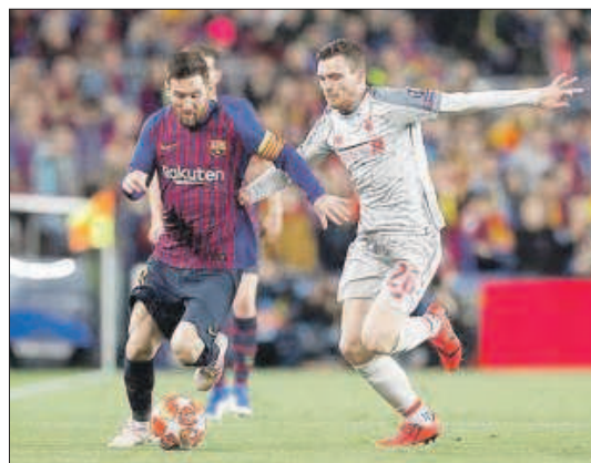
Messi controla davant Robertson en el duel d'anada.

El central holandès no va poder completar l'entrenament d'ahir