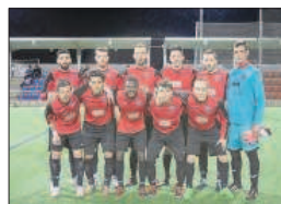
L'Atlètic Escaldes durant un partit.

L'Atlètic Escaldes només necessita sumar un punt per ser, matemàticament, equip de primera. Després de la golejada del cap de setmana passat al Ranger's, per